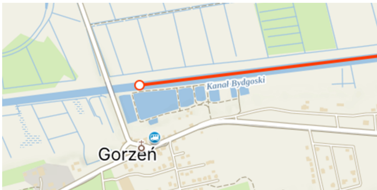
Strefa mety oraz kierunek dopłynięcia do pomostów przy służie Lisi Ogon